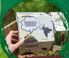
SENTIER DES FOURMIS