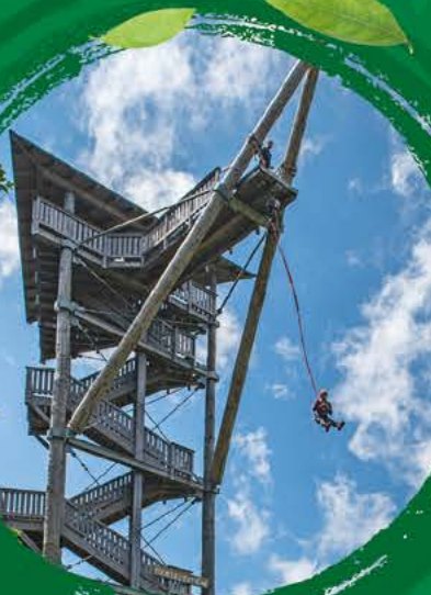
TOUR DE L'EXTREME SAUT FLIGHTLINE