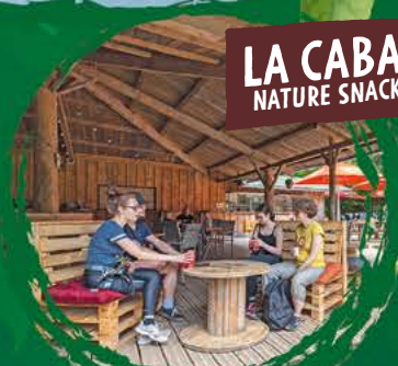
LA CABANE NATURE SNACK BAR