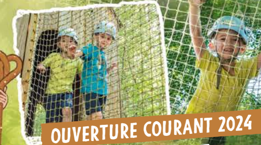
OUVERTURE COURANT 2024

L'AVENTURE EN TOUTE LIBERTÉ POUR LES 3- 11 ANS !