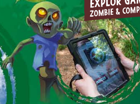
EXPLOR GAMES® ZOMBIE & COMPAGNIE